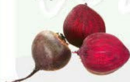
la remolcha la betabel la betarraga