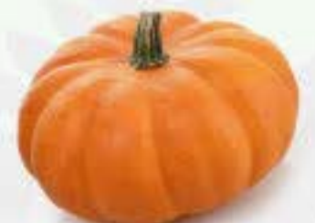
el zapallo la calabaza