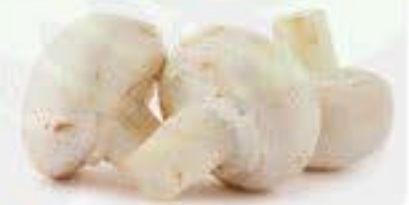
el champiñón la seta