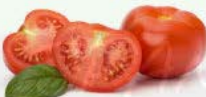
el tomate (es una fruta)