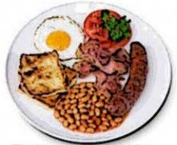
El desayuno inglés