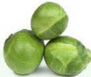
las coles de Bruselas