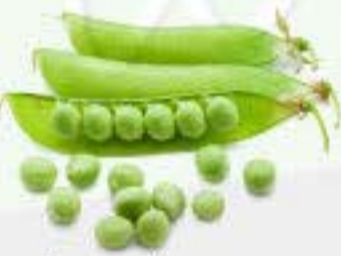
el guisante la arveja