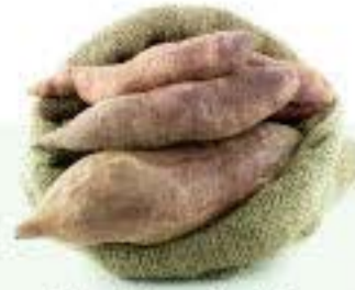
la batata el camote