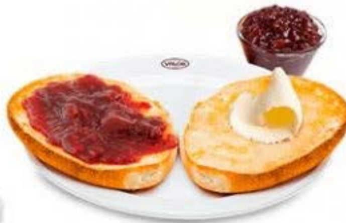
La tostada con mantequilla y mermelada