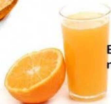
El zumo de naranja