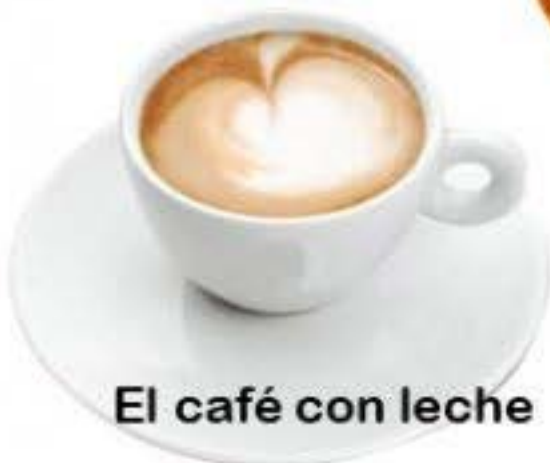
El café con leche