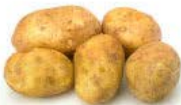
la papa la patata