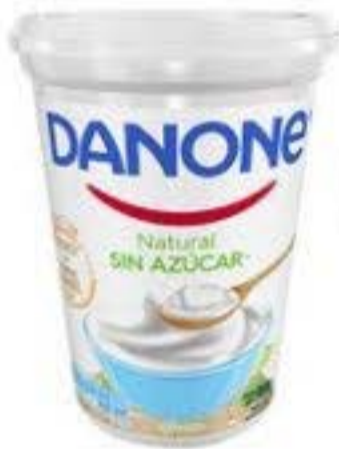
El yogurt natural