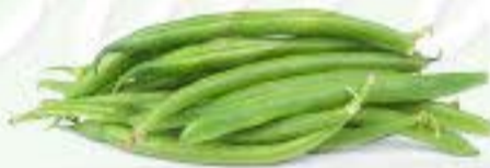
la judía la habichuela el poroto el frijol