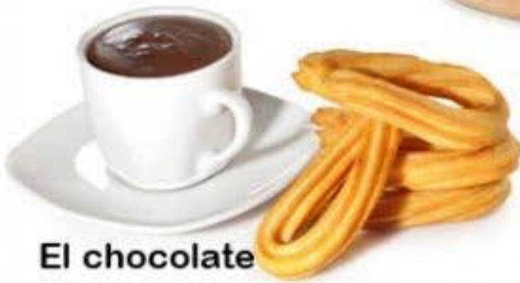
El chocolate con churros