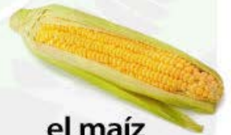
el maíz el choclo