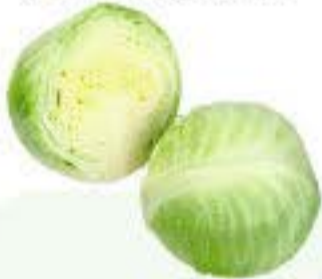
el col el repollo