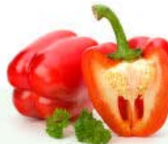
el pimiento el pimentón