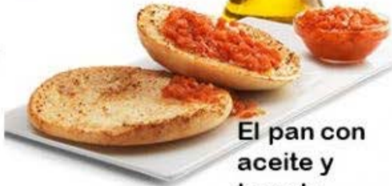
El pan con aceite y tomate